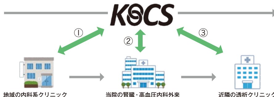
地域の内科系クリニック