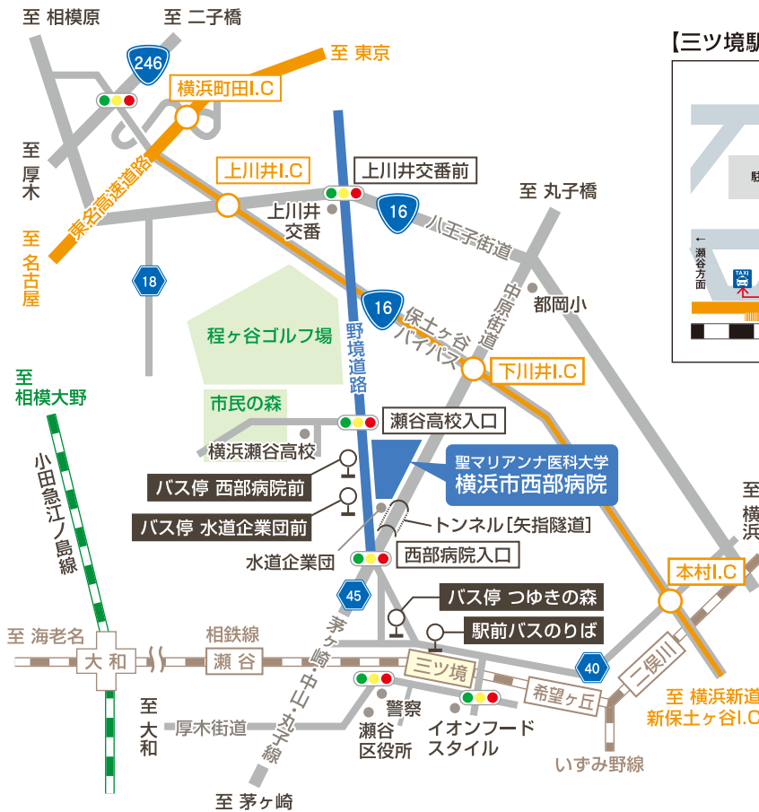
【三ツ境駅北口 案内図】